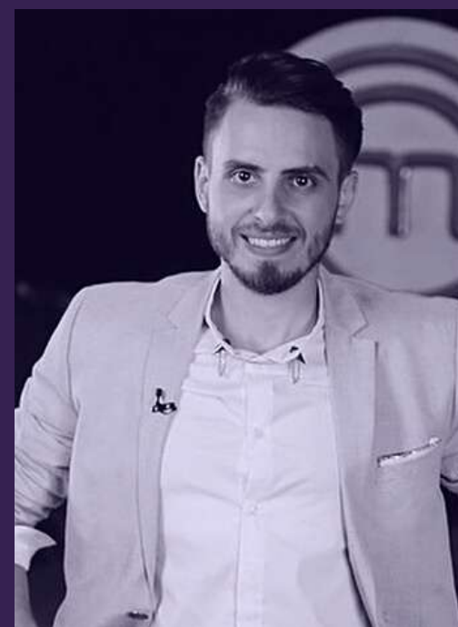
chef FOA & team