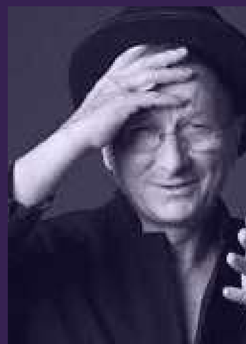
licitație de artă