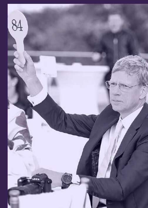
CEOs & diplomats